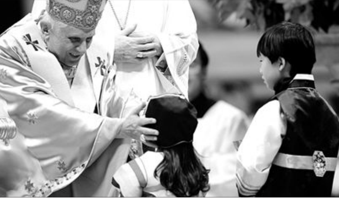
교황, 한국어린이에게 축복 교황 베네딕도 16세가 크리스마스인 25일 바티칸 성 베드로 광장에서 한복을 입은 한국 어린이들에게 축복하고 있다.

지난 2000년이후 가격이 가장 많이 오른 외식 품목은 등심구이와 쇠갈비인 것으로 나타났다. 반면 김밥과 피자, 탕수육 등의 가격은 6년여간 별로 오르지 않은 것으로 조사됐다. 25일 통계청에 따르면 2000년을 100으로 했을 때 지난 11월 현재 조사대상 36개 품목의 외식가격 지수는 119.3으로 연평균 3%를 약간 웃도는 상승률을 기록했다. 품목별로는 등심구이가 가격이 2000년이후 56.1%나 상승, 조사대상 품목중 가장 많이 올랐다. 쇠갈비 가격도 47.7%나 올라 그 뒤를 이었다. 서민들이 많이 찾는 삼겹살이 29.5%, 학교급식비 28.9%, 돼지갈비는 27.8%가 각각 올라 상승률 상위 5위권 안에 들었다. 불고기(25.8%), 햄버거(25.0%), 갈비탕(24.8%), 튀김닭(24.5%), 자장면(24.3%), 짬뽕(24.0%), 소주(23.4%), 삼계탕(21.7%) 등의 가격 상승률도 전체 평균을 웃돌았다. 반면 생선초밥(14.7%), 돈가스(14.4%), 비빔밥(13.3%), 된장찌개(12.3%), 냉면(11.4%), 김치찌개(11.3%) 등은 평균보다 가격이 덜 올랐고 김밥(1.2%), 맥주(2.3%), 탕수육(6.8%), 피자(7.9%) 등은 6년여간 가격이 거의 오르지 않거나 상승률이 미미했다. 〔최정호기자 choice@kwangju.co.kr〕