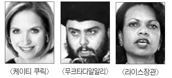
〈케이티 쿠릭〉 〈무크타디알리리〉 〈라이사장관〉

지난 10월 핵실험으로 세상을 깜짝 놀라게 한 북한의 김정일 국방위원장(65)이 24일 시사주간지 타임이 선정한 ‘2006년 중요한물 26인’에 포함됐다. 타임은 “김위원장은 지난 7월4일 미사일 실험으로 조지 부시 미 대통령의 독립기념일 백악관 파티를 망친데 이어 10월 세계에서 가장 배타적이고 위험한 핵클럽 회원국의 수장이 됐다”고 소개했다. 이 주간지는 김 위원장을 ‘가장 위험한 클럽의 문을 강타한 사람’ 등으로 표현하면서 핵실험 이후 북한을 소홀히 했던 미국이 ‘악의 축’이나 북한의 열악한 인권 상황 등을 더 이상 언급하지 않고 북한이 핵무기를 포기한다면 모든 종류의 경제, 외교적 혜택을 거기에 주려 하는 등 그의 대답만 도전을 효과적으로 보고 있다고 말했다. 한편 타임은 ‘부시 대통령-티 체니 부통령-도널드 럼즈펠드 전 국방장관’ 등 세사람을 한 팀으로 묶어 26인 중 한 명으로 선정하면서 한때 ‘안보 드림팀’이었