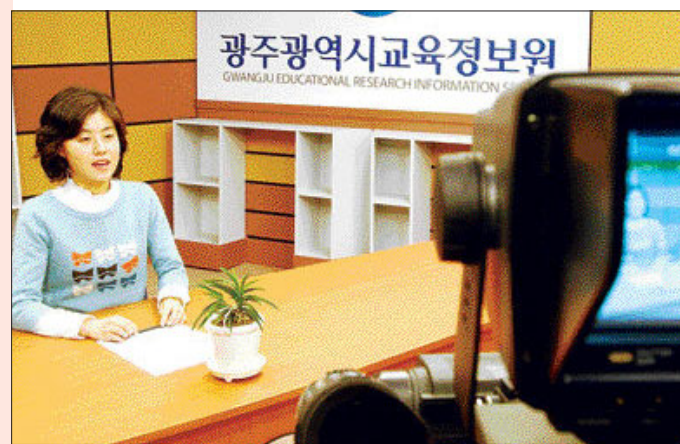
광주교육포털의 동영상 서비스 '초등 글쓰기' 녹화 장면.

방법 차이 등을 배우게 된다. 마지막으로 논술하기를 통해 '나만의 개성', '왕따', '인터넷' 등 주제를 갖고 본격적인 논술쓰기에 도전한다.