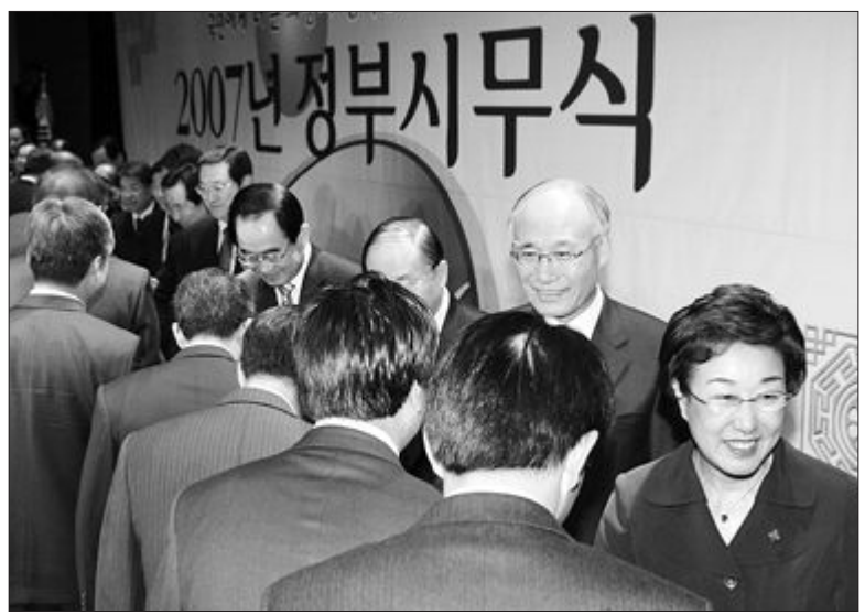
한명숙 총리와 국무위원들이 2일 오전 서울 세무시무식에서 각처 고위공무원들과 악수하고 있다.

에서 전문가가 돼 주길 바란다”고 말했다. 박 지사의 ‘프로’ 발언은 조만간 있을 정가인사를 앞두고 주목을 끌고 있다. 그는 이어 “성공한 기업인들은 시장분석과 환경분석을 게을리하지 않는 등 ‘물(규칙)’에 충실했다”며 “공직자들도 법과 윤리강령의 큰 틀을 기초로, 어느 한 분야에서 전문가가 되기 위해 창조적인 노력을 기울여야 할 것”이라고 당부했다.