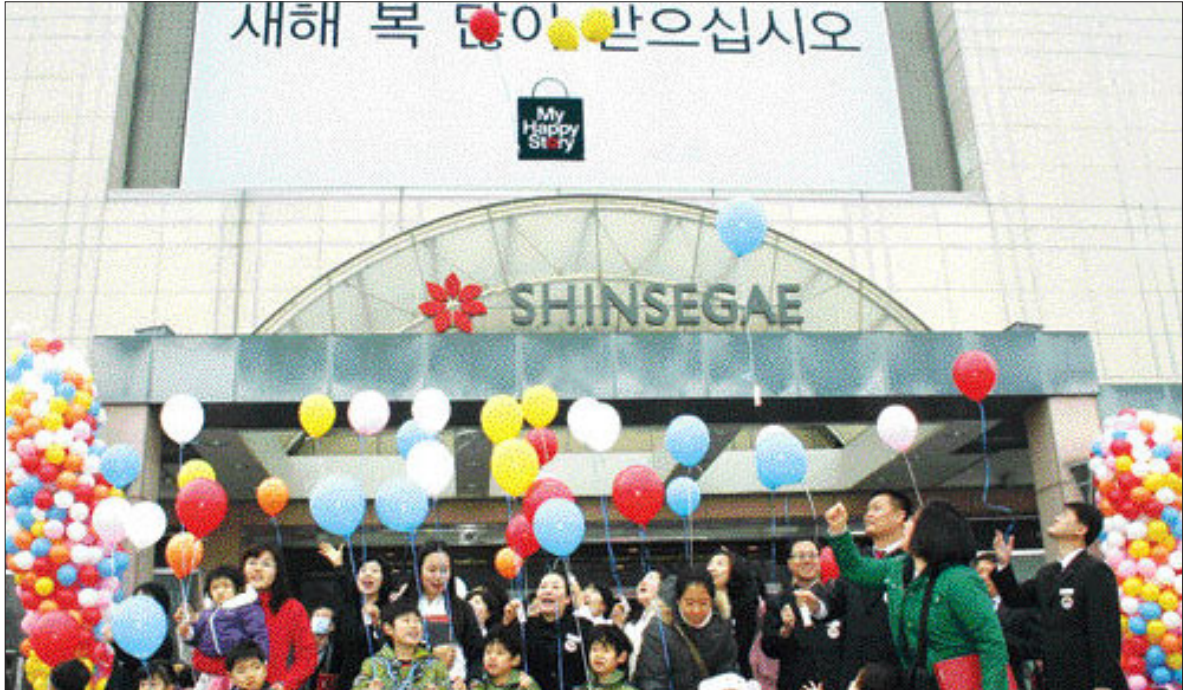
풍선에 담은 정해년 소원 2일 광주신세계 주최로 백화점 정문에서 열린 '소원성취 풍선 날리기' 행사에 참가한 가족단위 고객들이 풍선에 각자의 소망을 담아 날려 보내고 있다.

이면서 상대적으로 가격이 낮은 경우나 대출액이 5천만원 이상 소액대출의 경우 예외적용 하는 방안도 검토 중이다.