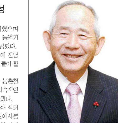
백막장, 동탄산업훈장 등을 수상했으며 지난 2002년에는 전남대학교에서 명예 경영학박사 학위를 받았다. /송기동기자 song@

최 회장은 국가와 지역사회 발전을 위해 힘써온 공로를 인정받아 국민훈장 석류장과 석탄산업훈장, 체육훈장