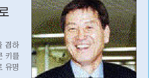
1980년 현역에서 은퇴한 그는 1989년까지 실업축구 주축은행에서 코치와 감독을 지냈으며 이후 행원으로 변신했다.

차범근 수원 삼성 감독과 함께 국가대표팀을 이끌었던 그는 당시 최고 스트라이커 한 명으로서 올드팬들에게도 이름이 널리 알려져 있다.