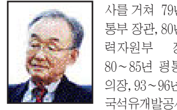
사를 거쳐 79년 교통부 장관, 80년 동력자원부 장관, 80~85년 평통 부의장, 93~96년 한국석유개발공사 사장을 역임한 뒤 2003년부터 기념사업회 회장을 맡아왔다. 유족으로는 부인 김재화씨와 2남1녀.

고인은 광주서고와 육군사관학교를 나와 57년 주한 미국대사관 수석무관, 60년 사단장을 지냈으며 지난 63년 예편해 주 필리핀·오스트리아·베트남 대