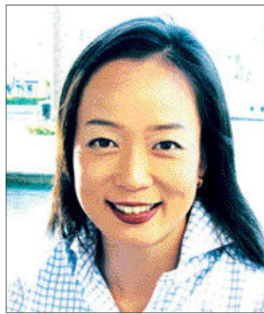
322편”이라고 날짜와 비행편을 똑똑히 기억했다.

조씨에게 가장 기억에 남는 일은 에미레이트 항공이 두바이-인천 노선을 처음 취항한 것. 2005년 5월 1일, EK