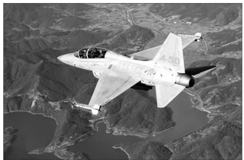
국산 초음속 경공격기 A-50 2011년부터 공군에 배치될 국산 초음속 경공격기 A-50. 군 소식통은 9일 “2011년부터 2015년까지 A-50 경공격기 60여대가 공군에 배치된다”고 말했다.

통해 “그동안 광주공항은 지역경제인 뿐만 아니라 공무원을 비롯한 모든 시민들의 부단한 노력으로 여객과 화물이 꾸준히 증가해 호남권 화물의 대부분을 점유하게 됐다”면서 “이런 상황에서 정부가 공항 이용객의 특성이나 시간 및 교통비용의 규모, 이용객의 고통비용 등을 고려하지 않은 채 공항기능을 무안으로 이전한다는 것은 말도 안된다”고 반박했다. /이종태기자 jilee@kwangju.co.kr