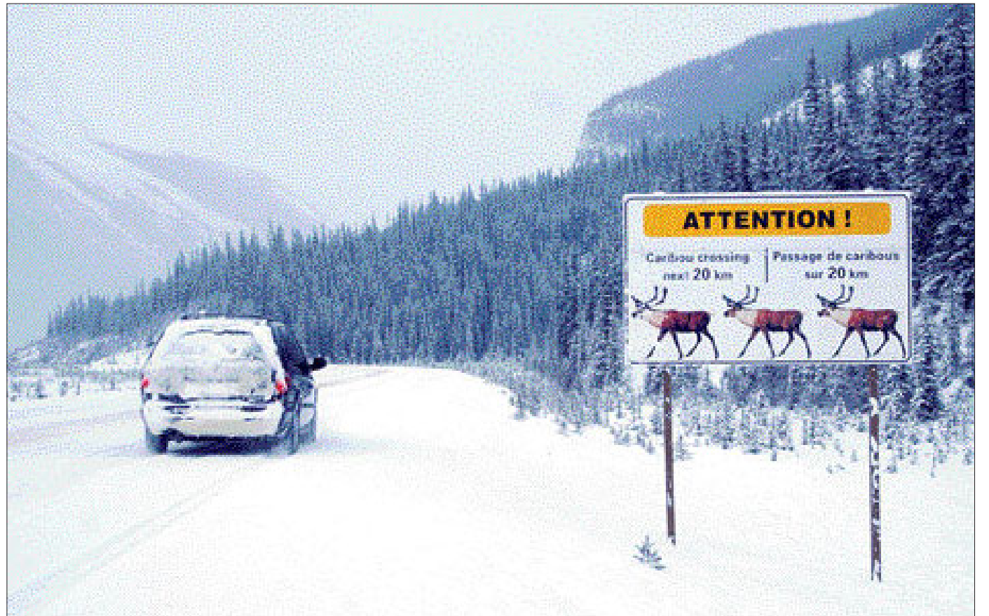
“순록 조심” 밴프와 재스퍼 국립공원의 주요 도로인 캐나다 대륙 횡단 고속도로와 아이스필드 파크웨이 곳곳에 잦은 동물 출현을 알리는 주의 표지판이 설치돼 있다.

곡식 등을 수송하는 화물열차에서 떨어지는 곡식류를 먹기 위해 철도로 뛰어든 야생동물들의 열차 사고가 빈번함에 따라 열차가 운행하면서 철길에 떨어진 곡식류를 모두 청소하기 위해서다. 재스퍼 국립공원 관계자는 "자연보호는 단순하다. 항상 자연의 편에서 생각하고 배려하는 것"이라며 "사람이 자연의 작은 부분에도 세심한 신경을 쏟고 배려하면 자연은 인간에게 많은 것을 되돌려 줄 것"이라고 말했다.