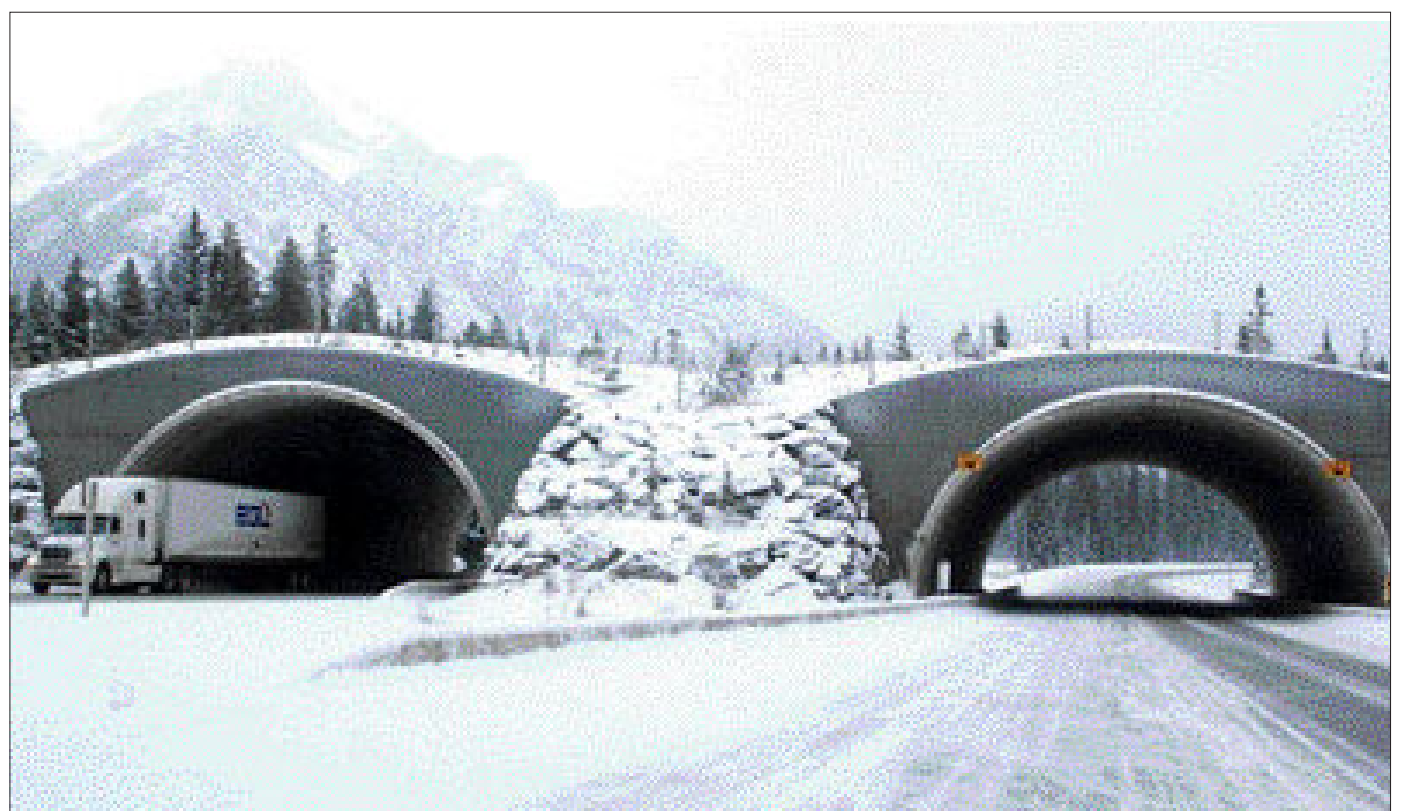
이동통로 밴프 국립공원 내 밴프시와 루이스 호수를 잇는 캐나다 대륙 횡단 고속도로에는 야생동물이 이동할 수 있는 지하통로와 육교가 1km구간 마다 1개씩 설치돼 있다.