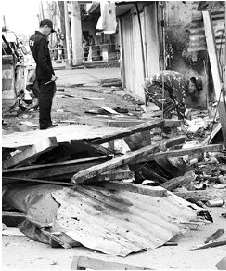
아세안 정상회의를 하루 앞둔 11일 필리핀 민다나오 제너럴 산토스에서 발생한 폭탄 테러 현장을 경찰이 조사하고 있다.