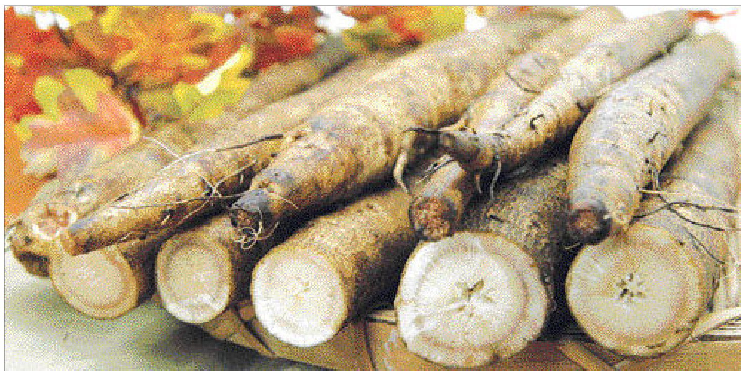
우영은 국화과의 두해살이풀로 뿌리와 어린 잎은 식용으로 이용하고 씨는 약제로 쓴다. 유럽이 원산지인 우리나라와 일본에서 많이 재배하는 뿌리 채소이다.

을 더욱 늘리고, 대장의 연동 운동을 촉진한다. 장내 박테리아의 활동을 도와 발효 가스를 발생시켜 배변을 돕기도 한다. 이눌린 성분은 우영의 당질을 구성하는 주요 성분으로 이 때문에 우영이 당질성분을 다량 함유한 알칼리성 식품으로 꼽힌다. 여기에도 우영에 풍부한 올리고당은 장내 유산균의 일종인 비피더스균의 먹이가 되기 때문에, 올리고당을 많이 섭취하면 유산균을 늘려서 장운동을 활성화하고, 장을 깨끗하게 유지하는 작용을 한다고 알려져 있다. 지난 2001년 국제 영양세미나에서 일본 도쿄대 이토 기쿠지 교수는 “우영의 올리고당은 체중을 줄이고 위장의 기능을 유지시키며 변비를 완화하고 대장암 발생위험을 줄여준다”는 연구 결과를 발표하기도 했다.