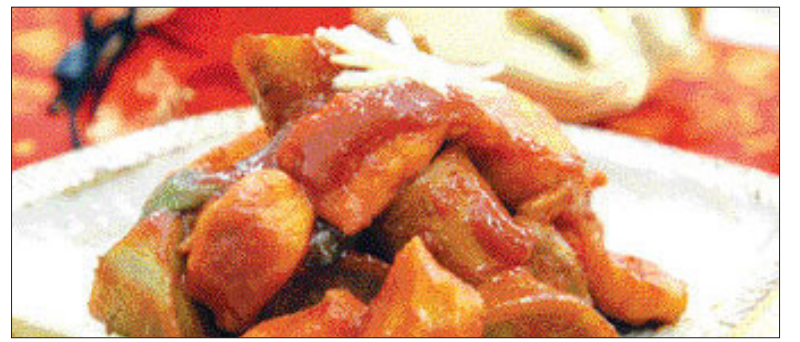
▲우영 달걀 조림=<만드는 법> ①우영은 껍질을 벗긴다음 3cm크기의 삼각형 모양으로 잘라 식육물에 담근다 ②달걀 안심을 우영크기로 자르고, 파리고추의 꼭지를 제거한다 ③마늘은 곱게 채썰어서 찬물에 담근다 ④조림장(고추장, 간장, 맛술, 물엿, 설탕, 소금, 후춧가루, 물)을 만든다 ⑤냄비에 조림장과 우영을 넣고 조리다가 반정도 졸여지면 달걀안심을 넣는다 ⑥⑤의 조림 국물이 4큰술 정도 남으면 파리고추를 넣고 버무리듯이 섞어 뚜껑을 덮고 3분정도 뜸을 드린다.