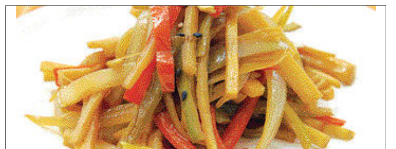
▲우영 고추 집채=<만드는 법> ①우영의 껍질을 벗겨 채썰어서 식육물에 담근다 ②고추는 씨를 제거하고 우영과 같은 크기로 채썬다 ③양파와 죽순도 같은 크기로 썬다 ④양념(간장, 소금, 후춧가루, 참기름, 식초, 물)을 만든다 ⑤팬에 기름을 두르고 우영을 볶다가 양파, 죽순, 고추순으로 넣고 볶는다.