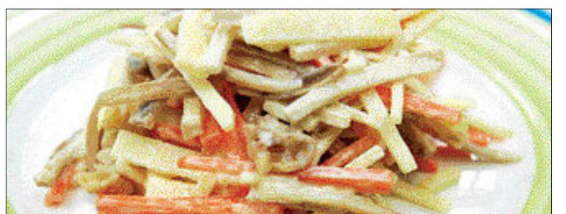
▲사과 우영 샐러드=<만드는 법> ①우영을 4cm 길이로 가늘게 채썰어 찬물에 20분 정도 담가둔다 ②식초를 조금 넣은 물에 우영을 데친다 ③사과의 껍질을 벗겨 4cm 크기로 채썬 다음 샐러드에 담근 후 물기를 뺀다 ④호두를 곱게 썰고, 요구르트 드레싱(요구르트, 마요네즈, 레몬즙)을 만들어 뿌린다.

<도움 주신분 = 김지현 요리학원 박은영 연구원·푸드 스타일리스트 김나형>