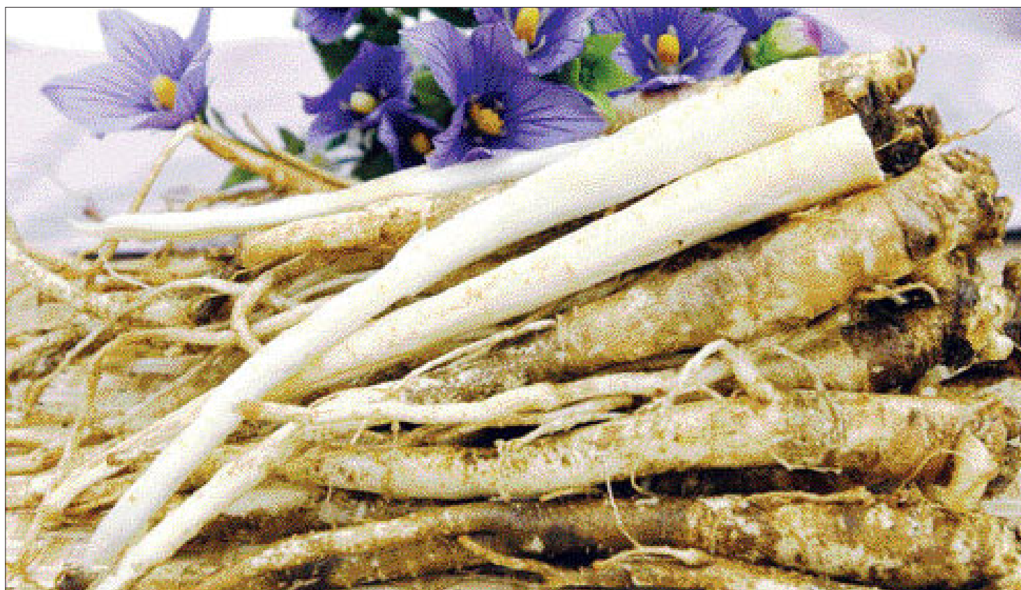
도라지는 초롱꽃과 도라지속으로 분류되는 다년생초다. 흰색 꽃이 피는 것을 백도라지, 꽃이 검으로 피는 것을 검도라지라고 한다.

홍미롭게도 도라지 추출물은 텔로미어에 효소의 활성화를 막는 것과 연관이 있으며, 이를 조절하는 유전자의 발현을 강력하게 억제한다는 사실이 규명된 것이다.