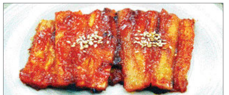
▲도라지 구이=<만드는 법> ①쓴맛을 뺀 도라지를 깨끗이 씻어 물기를 제거한 뒤 조각으로 잘라 밑에 납작하게 민다 ②①에 참기름과 장을 약간 발라준다 ③고추장, 진간장, 대파 다진 것, 마늘 다진 것, 설탕, 물엿, 참기름을 넣어 양념장을 만든다 ④팬에 기름을 두른 후 ②를 앞 뒤로 살짝 지진다 ⑤④에 ③의 소스를 앞 뒤로 2~3번씩 발라가며 굽는다.