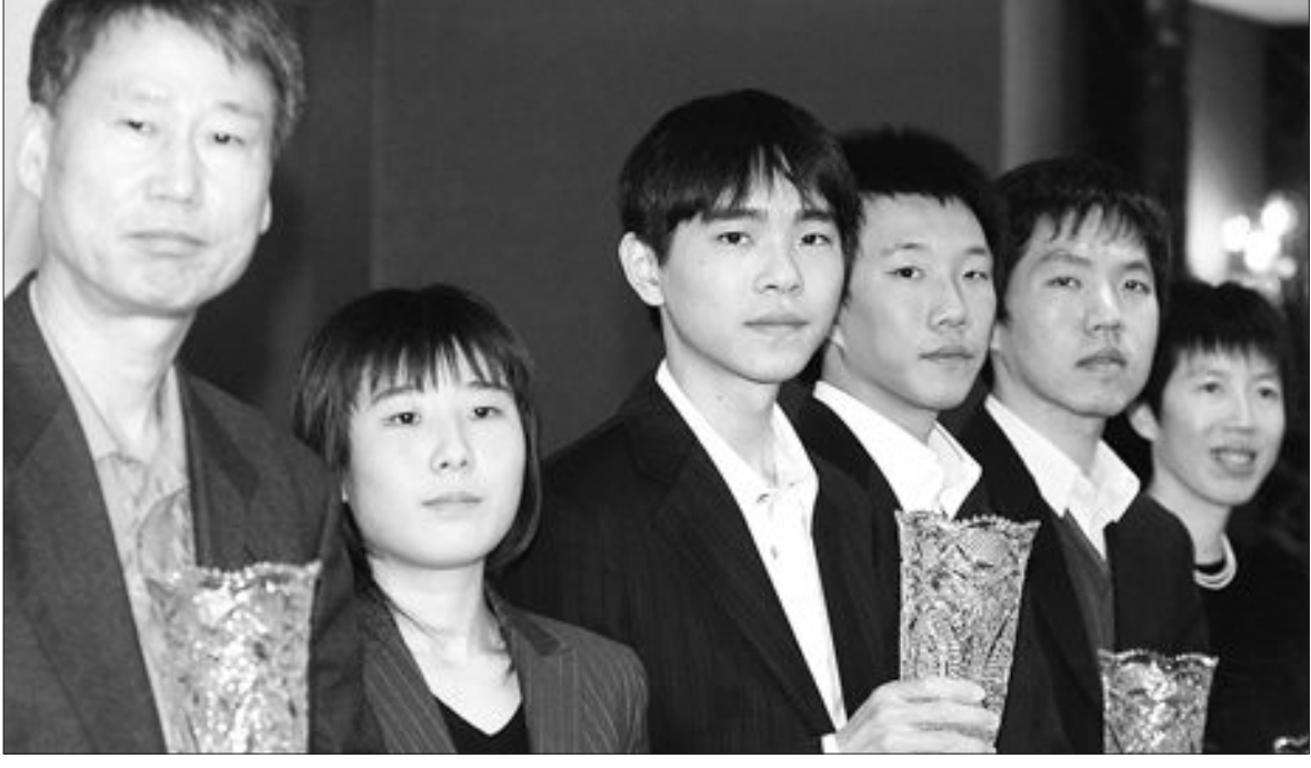
'2006 최고의 기사' 이세돌 9단 선정 (우수기사상), 루이나이웨이(여자기사상) 등 수상자들이 포즈를 취하고 있다. (사진 왼쪽부터)

본선은 24강 토너먼트로 치러지며 우승 상금은 2천500만원(준우승 1천만원)이다. /윤영기기자 penfoot@