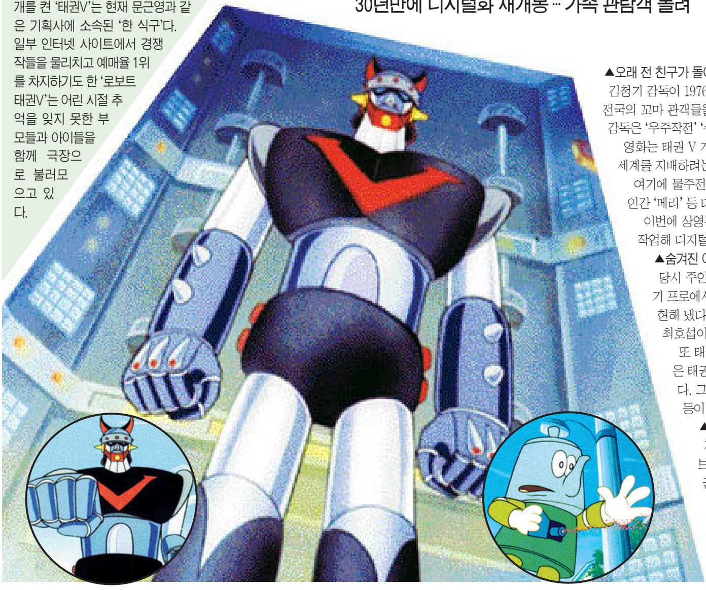
‘로봇 태권 V’의 태권도 실력은 전문가들의 감정결과 약 3단 정도로 알려졌다. 오른쪽 위안은 귀여운 ‘강릉로봇’.

‘추억’이 현실이 되었다. 단순히 영화를 넘어 30~40대들에게 어 린 시절의 잊을 수 없는 추억으로 깊이 새겨진 ‘로봇 태권 V’가 30년만에 다시 찾아온다. 30년전 ‘로봇 태권 V’와 ‘마징가 제트’는 영원한 라이벌이었다. ‘달려라 달려 로봇야~’로 시작되는 ‘로봇 태권 V’ 주제는 전국 어린이들의 애창곡이었다. 특히 TV로 방영된 ‘마징가 제트’와 달리 영화관에 가야만 볼 수 있었던 ‘로봇 태권 V’는 당시 꼬마들의 ‘극장’에 대한 ‘호기심’까지 만족 시키며 절정의 인기를 누렸다. 국산 애니메이션으로는 드물게 18일 150개관에서 개봉하며 30년만에 기지개를 켜 ‘태권V’는 현재 문근영과 같은 기획사에 소속된 ‘한 식구’다. 일부 인터넷 사이트에서 경쟁작들을 몰리치고 예매율 1위를 차지하기도 한 ‘로봇 태권V’는 어린 시절 추억을 잊지 못한 부모들과 아이들을 함께 극장으로 불러오고 있다.