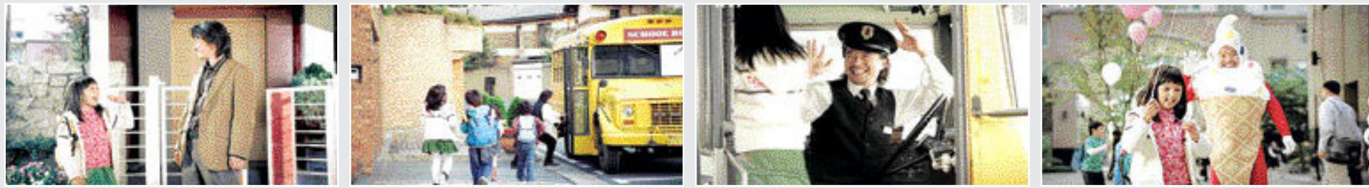
자녀가 무엇을 하는 지 알고 싶은 것은 모든 부모 마음이다. 자녀가 유치원에 간 뒤 "아이가 걱정된다"며 온종일 따라다니는 아빠를 내용으로 한 이동통신사 광고.

KTF '아이플러그' 출시 오늘부터 84개市 서비스 SKT 'T로그인'에 도전장