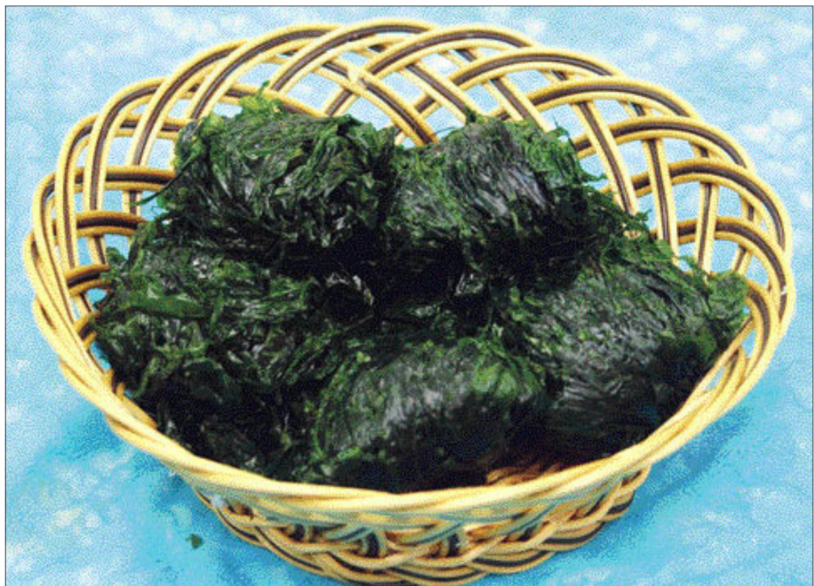
파래는 주로 민물이 섞이는 바닷가에서 자란다. 김처럼 넓고 길게 생긴 갈파래류와 머리카락처럼 가늘고 긴 잎파래류 두 종류로 나뉜다.