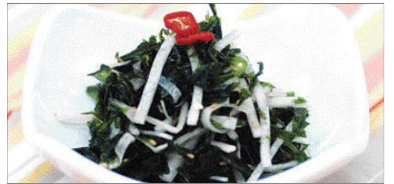
▲파래무침= ①파래를 깨끗이 씻어 잘게 다진다 ②무는 4cm 길이로 채썰고 청, 홍고추는 어슷하게 썬다 ③설탕, 식초, 간장, 다진 파, 다진마늘, 깨, 소금을 넣어 양념장을 만든다 ④ ③에 파래와 무, 청,홍고추를 넣고 무친다.

/윤영기기자 penfoot@kwangju.co.kr