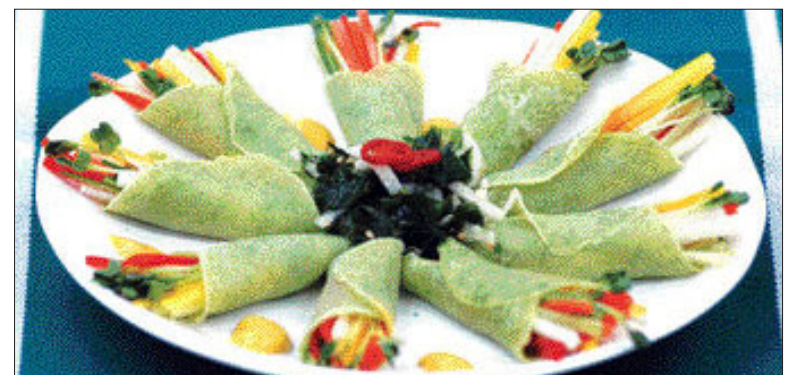
▲파래 밀전병 야채말이= ①파래를 믹서에 넣고 간다 ② 밀가루에 ①과 소금을 넣고 반죽한 후 체에 한번 내린다 ③당근, 오이, 청피망, 노란 파프리카를 5cm 길이로 채썬다 ④팬에 ②를 지름 6cm 크기로 얇게 지진다 ⑤얇게 지진 파래 밀전병을 준비해 놓은 야채들을 넣고 말아준다 ⑥겨자 소스를 곁들인다.