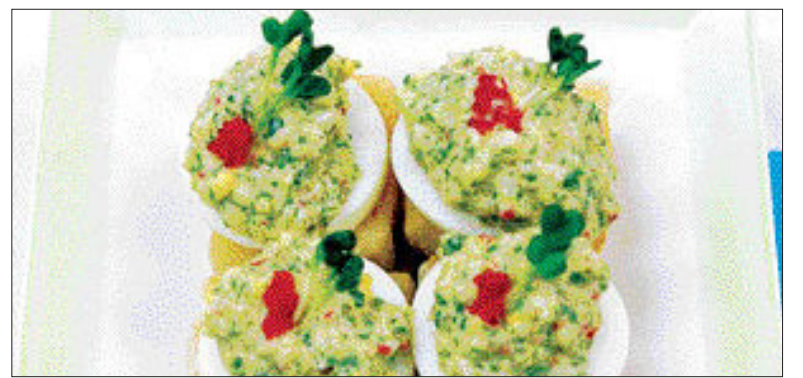
▲파래 두부 카나페= ①두부는 2cm 크기로 썰어 녹말을 골고루 입힌다 ② 녹말을 입혀놓은 두부를 노릇하게 튀긴다 ③달걀은 삶아 커깁기로 썬다 ④파래, 맛살, 피클, 노른자를 잘게 다져 마요네즈, 설탕,소금을 넣어 섞는다 ⑤두부 위에 삶은 달걀을 놓고 ④를 적당량 올린다.