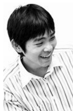
도요타테노배 우승 이세돌 9단