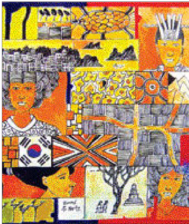
주재현 작 'MEMORY'