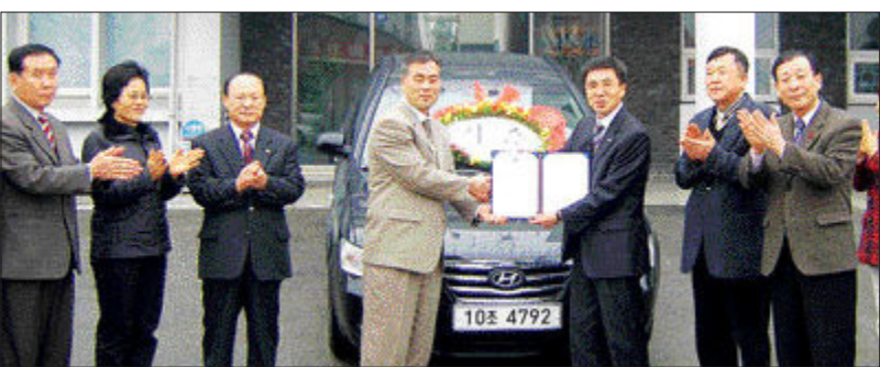
에덴토건(주)은 최근 자매 결연을 맺은 대한민국 전물군경유족회 광주지부를 방문 ‘현충탑 지킴이’ 봉사 활동을 위해 써달라며 승용차를 전달했다.