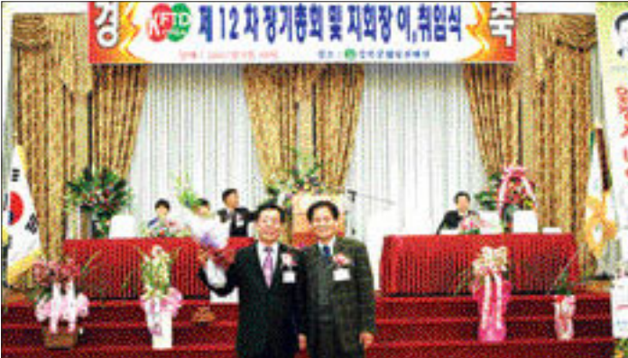
(사)한국화원협회 광주시지회는 지난달 30일 광주시 경복궁 웨딩홀에서 제12차 정기총회 및 제7대 지회장 및 회장단 감사 이·취임식을 개최했다.