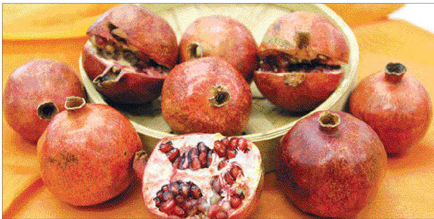
석류의 원산지는 서아시아와 인도 서북부 지역이며 국내에는 고려 초 중국을 거쳐 들어온 것으로 추정된다. 품종은 단맛이 강한 감과와 싹맛이 강한 산과로 나뉜다.

특히 석류에 함유된 비타민C와 미네랄은 생리작용을 활성화해 숙취해소에도 좋다. 여기에다 석류의 타닌 성분은 위장을 보호, 보강하는 작용을 하면서 지방분해를 촉진하기 때문에 꾸준히 섭취하면 비만을 예방할 수 있다고 한다.