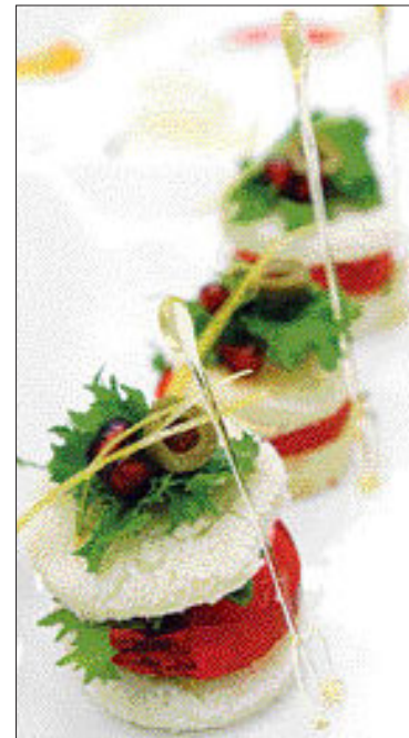
▲석류 카나페 (왼쪽) ①식빵을 지름 4cm 크기로 썰어 노릇하게 굽는다 ②식빵 위에 마요네즈를 바르고 석류젤리를 얹는다 ③젤리 위에 샐러드와 석류알을 장식한다.

석류를 고를 때는 껍질이 갈색에 가깝고 길이 약간 길어져 속이 조금씩 보이는 것을 택해야 한다.