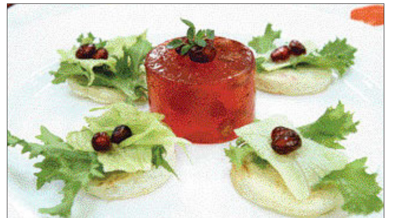
▲석류 젤리 ①젤라틴을 찬물에 불려 증탕으로 녹인다 ②석류주스를 젤라틴과 섞는다 ③②를 모양틀에 넣어 식힌다.