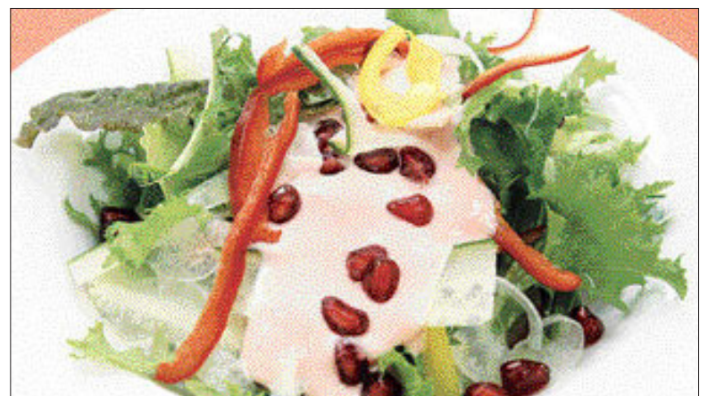
▲석류 샐러드 ①양상추, 상추, 치커리 등 샐러드 야채를 먹기 좋게 자른다 ②석류즙, 레몬즙, 오일, 소금, 후추를 넣어 드레싱을 만든다 ③샐러드위에 드레싱을 뿌리고 석류알을 올려 장식한다.