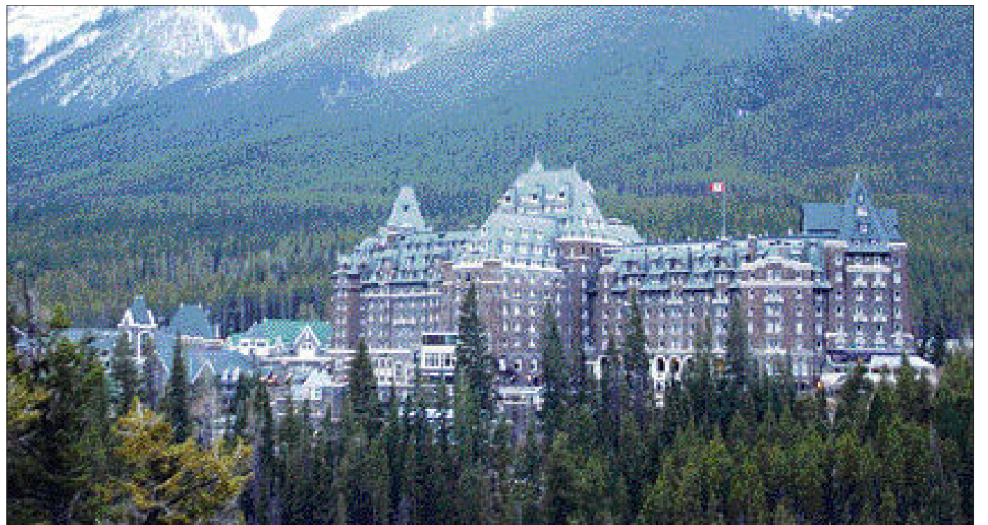
자연과 하나된 호텔들

밴프시는 인구 5천여명의 소도시이지만, 캐나다인 특유의 관광 거점 도시이자, 캐나다 최고의 관광도시로 자리하고 있다. 밴프 시가지(사진 상)와 그림같은 밴프의 호텔(사진 중·하)