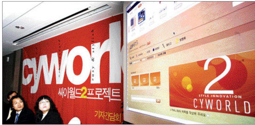
SK커뮤니케이션즈가 지난날 30일 ‘사이월드 2’를 시범 공개했다. 미니홈피나 블로그, 게시판, 클럽 등의 서비스를 자신이 원하는 형태로 다양하게 변형, 활용할 수 있는 것이 가장 큰 특징이다. 시범 서비스 기간을 거쳐 오는 3월 정식으로 개장할 예정이다.