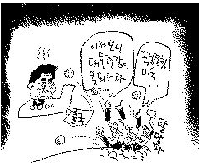
쫓듯... '너나 잘 하세요'