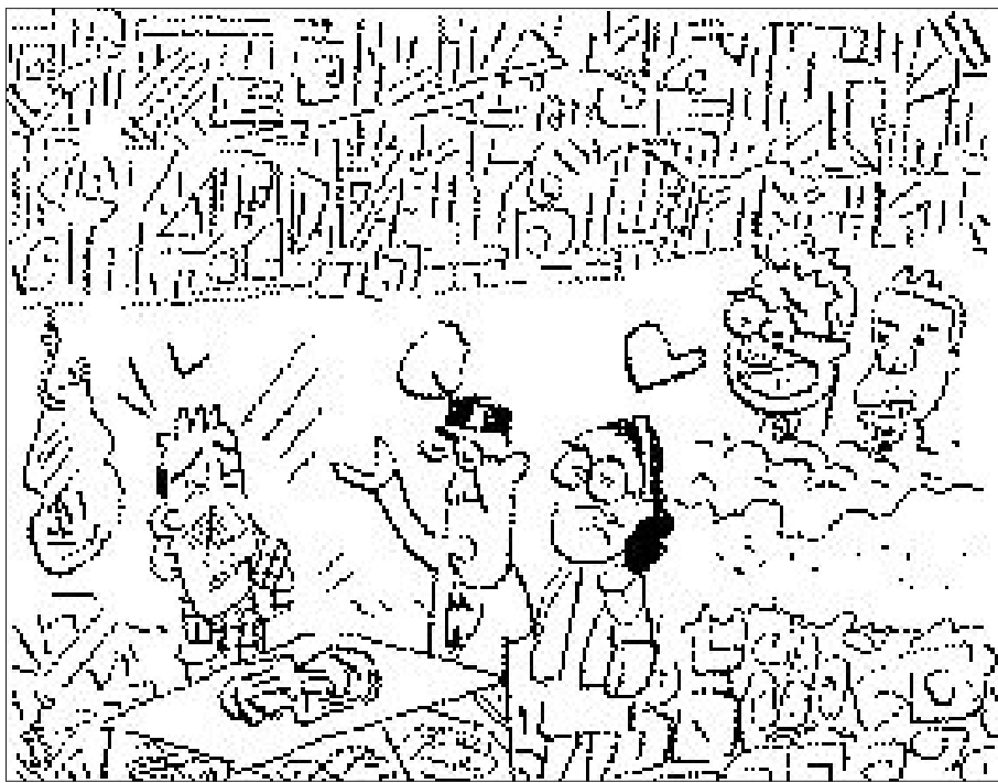
찾아보세요 송사리, 펜촉, 알파벳 A자, 뚝, 뿔, 열대어, 서클, 새집