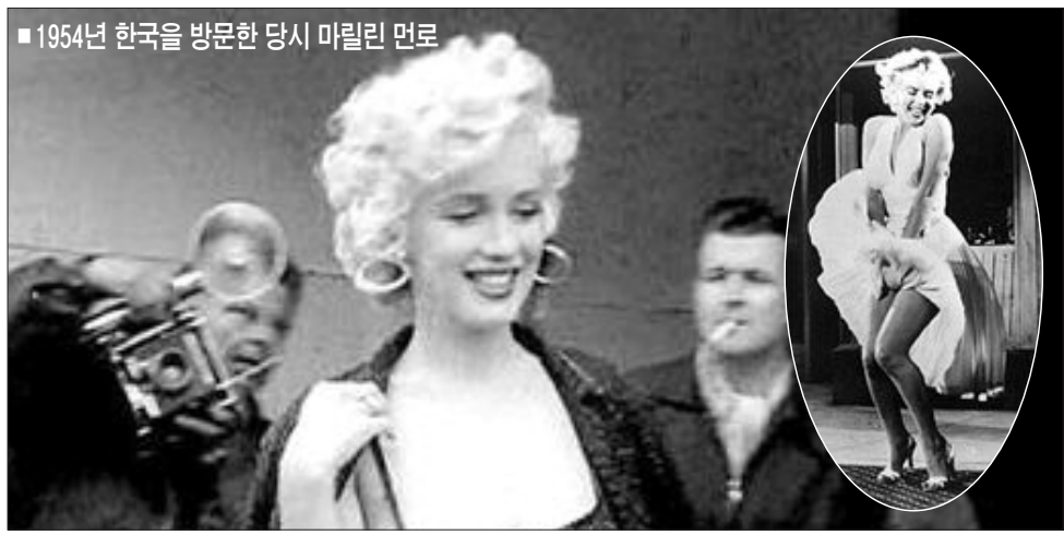
1954년 한국을 방문한 당시 마릴린 먼로

에 수용되면서 고아로 자라야 했다. 열다섯살에 첫번째 결혼을 했고 두 번째는 야구선수 조 디마지오와, 그리고 극작가 아서 밀러와 세 번째 결혼식을 올렸다. 먼로가 스타덤에 오른 것은 지난 1953년 '나 이야기'가 크게 성공하면서부터. 이후 '돌아오지 않는 강(54년)' '7년만의 외출(55년)' '뜨거운 것이 좋아(59년)' 등에 출연하며 섹스 심벌로 떠올랐다. 그녀는 당시 여자의 최대 무기로 육체를 대중 문화계의 속살을 증명한 배우로 통한다. 특히 영화 '7년만의 외출'에서 지하도의 통풍구 바람이 차가 차가 올라가는 장면(타일 사진)은 50년이 지난 현재까지 백치미로 표현되는 특유의 표정연기와 어울리면서 많은 사람들에게 기억되고 있다. 먼로는 디마지오, 밀러와 이혼한 뒤 프랭크 시나트라, 케네디 형제 등 훌륭한 남성들과 연분을 뿌리다 1962년 8월 5일 캘리포니아 자신의 방에서 약물 과다 복용으로 숨졌다. 숨진 뒤에 도 먼로의 사인을 둘러싼 의문과 논란은 끊임없이 제기되었다. /김지을기자 dok2000@