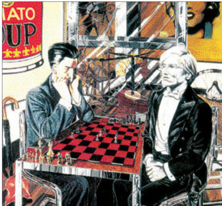
필립 코어 작 '재봉틀 작업대와 우산의 행복한 만남': 앤디 워홀과 마르셀 뒤샹(1978년). 동성애자로 알려진 뒤샹과 워홀이 성적 암시 가득한 자신들의 작품에 둘러싸여 체스를 두고 있다.