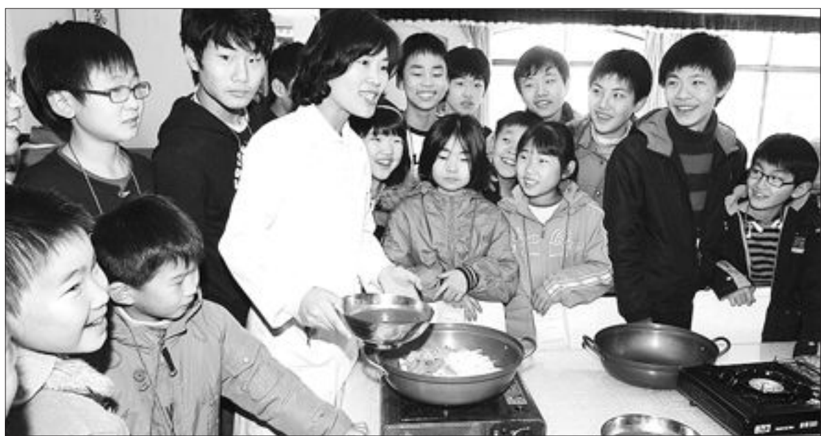
요리 배우기 즐거워요

총수은농도는 산도혈액의 21%, 제대혈의 60%가 독일의 기준치 5ppb를 초과했고 메틸수은농도는 제대혈의 22~39%가 독일과 미 EPA 기준치를 넘어섰다.