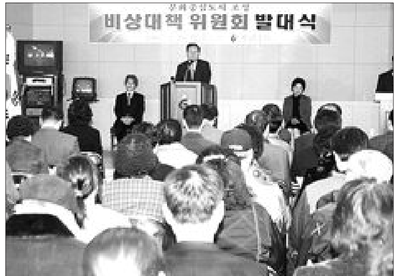
문화수도 조성 비대위 구성 '문화중심도시 조성 광주시 기념 1등 비상대책위원회'는 26일 오후 5시 동사무소에서 발대식을 갖고 조성사업 종합계획에 지역 주민의 의사가 반영될 때까지 투쟁해 나갈 것을 결의했다.

벌금을 부과했다. 한편 국세청은 세금 탈루 혐의가 짙은 고소득·전문직 자영업자에 대한 올해 첫 일제 세무조사를 실시하기로 했다. 국세청은 26일 "지난해 4차에 걸쳐 실시한 고소득 자영업자 세무조사 결과 분석, 불성실 신고 혐의자를 중심으로 315명을 선정해 오늘부터 5차 세무조사를 벌이기로 했다"고 밝혔다. /이종태기자 jtee@kwangju.co.kr