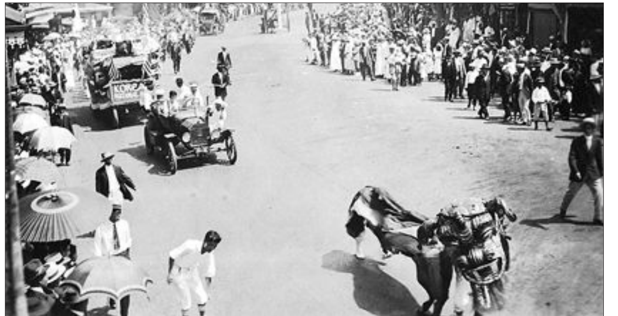
87년전 美 韓인 3·1운동 기념행사

지금까지 지식정보자원관리 사업을 통해 구축된 결과물은 약 2억 7천만 건으로 지식DB를 보유한 1천50개 공공·민간기관과 공동으로 국민이 편리하게 이용할 수 있도록 국가 지식포털(www.knowledge.go.kr)을 통해 일반인에게 제공하고 있다.