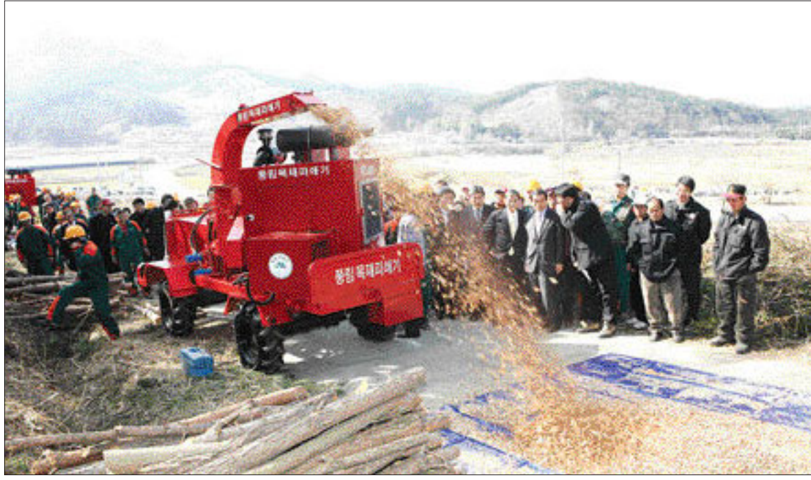
‘산림자원화 지원단’ 발대 보성군은 지난달 28일 오후 금천리 초암산 지구에서 ‘산림자원화 지원단’ 발대식을 가졌다. 50명으로 구성된 ‘산림자원화 지원단’은 초암산 및 봉화산 일대 650ha 산림에서 숲 가꾸기 사업을 실시하고, 부산물을 축산·원예농가에 저렴한 가격으로 지원한다.

표를 통해 “영암군 관내에 5개 고등학교가 있지만 동부권에 편중돼 있고 삼호읍에는 고등학교가 없어 인구유출 등 지역발전의 저해요인이 되고 있다”고 지적했다. 정교수는 따라서 “대불산단 활성화와 J프로젝트, 서남권 종합개발계획, 포물러 원(F1) 자동차 경기장 유치 등 지속적인 지역발전이 기대되는 만큼 고등학교 신설 외에는 대안이 없다”고 주장했다. 삼호고 설립추진위는 앞으로 ▲도교육청에 설립건의서를 제출하고 ▲교육인적 자원부, 청와대 방문 추진 ▲1만명 서명운동 등을 전개할 계획이다. 관련 전일영 추진위원장은 “늦어도 2010년까지 고등학교 설립이 이뤄질 수 있도록 최선의 노력을 다하겠다”고 말했다. /영암=김현남기자 hnkim@