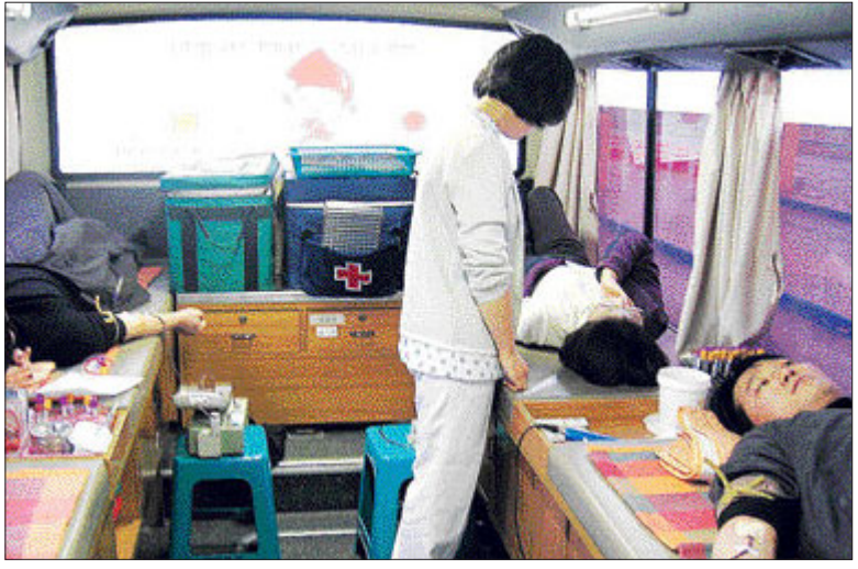
도공 옥과영업소 직원 단체헌혈 한국도로공사 옥과영업소 직원 18명이 최근 단체로 헌혈을 했다. 직원들은 혈액이 부족해 병원이마다 어려움을 겪고 있다는 보도를 접하고 자발적으로 헌혈에 나섰다. /곡성=김계중기자 kjkim@

장보고 대사의 해양 개척정신을 기리고 그 뜻을 이어 받아 해양수산 분야의 개척 활동이 뛰어난 사람이나 기관을 대상으로 표창하는 뜻깊은 상이다. 완도군의 이번 수상은 그 동안 장보고 대사의 위대한 해양개척 정신을 계승 발전시키기 위해 청해진을 사적 308호로 지정하고 청해진 유적지 정비 복원사업, 국내 최대의 장보고 동상 및 청해진 기념관 건립 사업을 활발하게 전개한 공로다. /완도=정은조기자 ejchung@