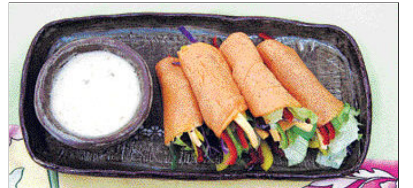
▲울무장떡볶이=①울무가루와 밀가루, 고추장, 물을 넣고 반죽하여 얇게 밀전병을 부친다 ②노랑파프리카, 청·홍 피망, 치즈를 채 썰고 양상추는 먹기 좋게 손질한다 ③소스(겨자, 식초, 설탕, 소금)는 재료를 모두 넣고 잘 섞는다 ④밀전병에 채소를 넣고 돌돌 말아 소스를 곁들인다.