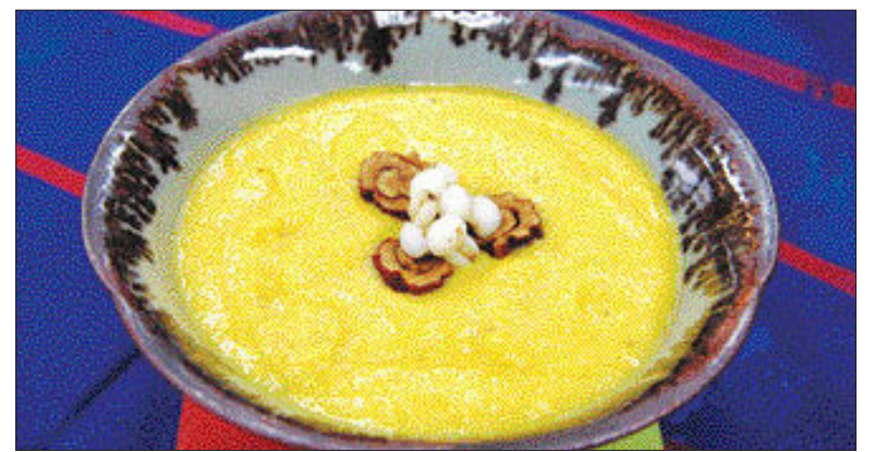
▲울무죽=①우유 1컵, 울무 가루1/2컵(80g)을 넣어 잘 섞는다 ②단호박은 껍질을 벗겨 삶는다 ③①을 ②와 함께 끓인다 ④그릇에 담고 대추로 곱명을 올린다.