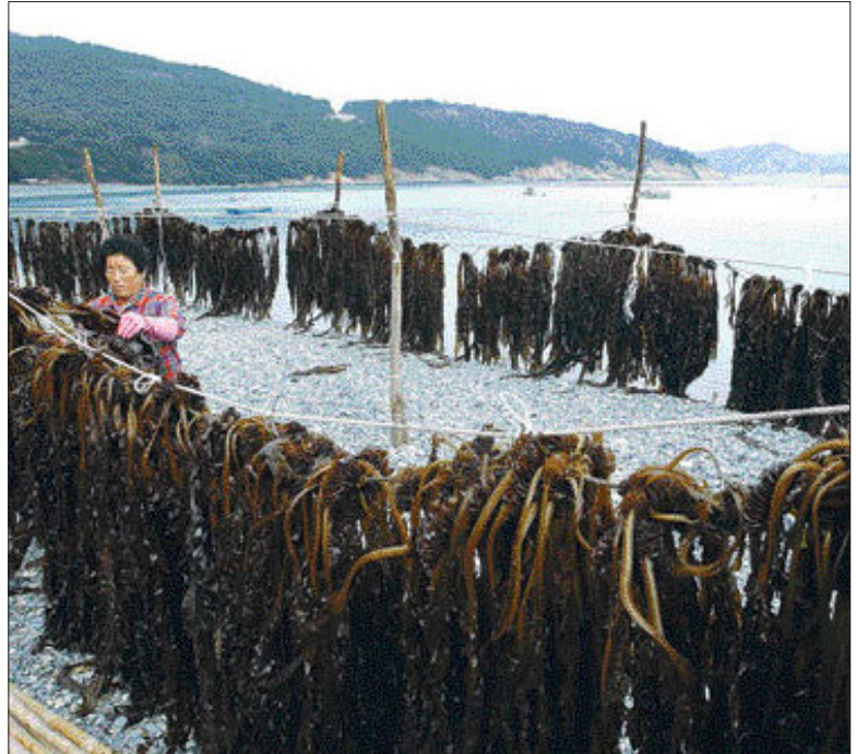
‘꼭지미역’ 말리기 한창 완도군 보길면 예송리 바닷가에서 ‘꼭지미역’ 말리기가 한창이다. 지역 특산물인 ‘꼭지미역’은 채취한 후 3일간 건조해 1kg당 6~7천원에 판매한다. ‘꼭지미역’은 한 줌 안에 들어올 만큼을 모아서 집어낸 미역을 일컫는다.