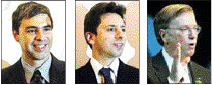
<래리 페이지> <세르게이 브린> <에릭 슈미트>