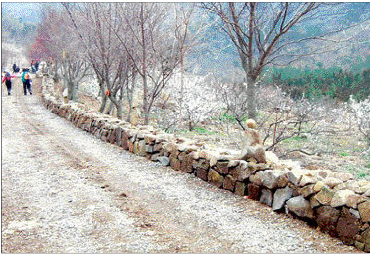
제암산 철쭉 테마공원 장흥군 제암산 철쭉 테마공원에서 철쭉 평원을 잇는 임도 1km 구간이 돌담으로 변신했다. 장흥군은 제암산 철쭉 행사와 연계한 새로운 볼거리 제공차원에서 돌담 구간을 늘려 나갈 계획이다. /장흥=김용기기자 ykjm@

대상으로 공모를 해 우선 30명을 명예면장, 이장으로 위촉할 계획이다”면서 “이 제도가 잘 운영되면 노령화로 인해 갈수록 활력을 잃어가는 농어촌이 생기를 되찾을 수 있고 도시민들에게는 웰빙공간으로 활용될 수 있을 것”이라고 밝혔다. 군은 활동실적이 우수한 명예면장, 이장에 대해서는 각종 인센티브를 제공하고 반응이 좋을 경우 점진적으로 확대해 나갈 방침이다. /완도=정은조기자 ejchung@