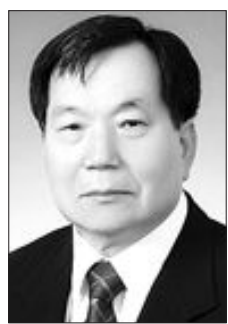
2007년부터 KBS 목포방송국 시청자위원회 위원장을 맡아오고 있다.

료), 목포대학교(명예문학박사)를 거쳐 초당대학교 기획실장 겸 사무처장, 교무부 총장을 지냈으며 1998년 문단(文壇)에 등단, 한국 문인협회 회원이다. /무안=이원희기자 whlee@