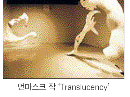
언마스케 작 'Translucency'