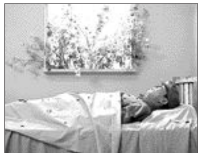
왕닝더 작 'somedays'