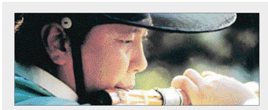
대금, 거문고... 봄을 전하는 소리