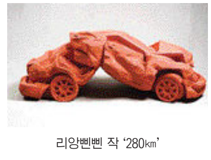
리양벤벤 작 '280km'