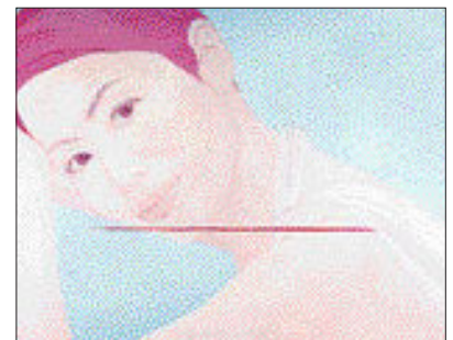
양미엔 작 'Standard of Beauty'