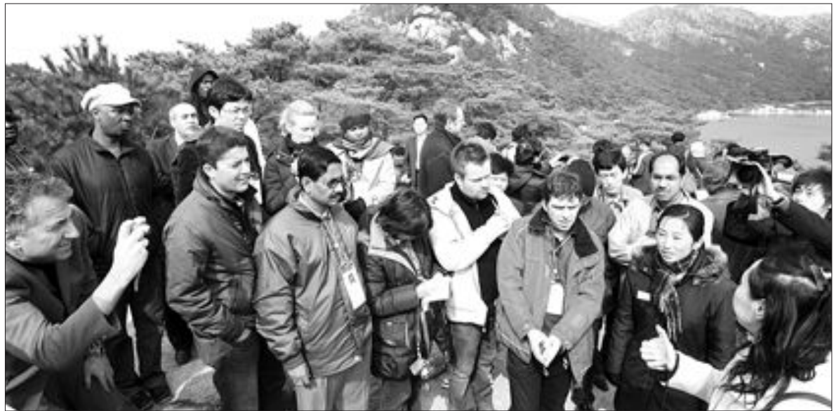
국제기자단 삼일포 관광 고 있다.

3천300가구, 부산 3천200가구, 대구 2천700가구, 충남 2천400가구, 강원 1천900가구, 경남 1천800가구, 경북 1천600가구, 충북 1천300가구, 전북 1천200가구, 광주 1천100가구, 울산·전남 각 800가구, 제주 700가구 순이다. 정부는 개인 증부세 대상자의 94%가 서울 강남지역을 비롯해 수도권 지역에 집중돼 있으며 전체 대상인원의 63.5%가 두 채 이상 집을 갖고 있는 것으로 분석된다고 밝혔다. 또 공시가격 15억원 이상의 집을 가진 사람들이 전체 세수의 48.8%를 담당할 것으로 예상된다. 정부는 올해 증부세수 2조8천814억원 중 약 1조7천700억원을 방과 후 영아케어센터 설치나 노인, 장애인 복지증진 등 교육·복지분야에 사용해 중앙·서민층에 혜택이 돌아가도록 할 방침이다. 올해 국민들이 부담하게 될 재산세는 주택분이 지난해보다 11.1% 늘어난 1조1천272억원, 토지분이 22.2% 늘어난 2조238억원으로 전체적으로는 18% 증가한 3조1천510억원으로 예상된다. /이종태기자 jtle@kwangju.co.kr