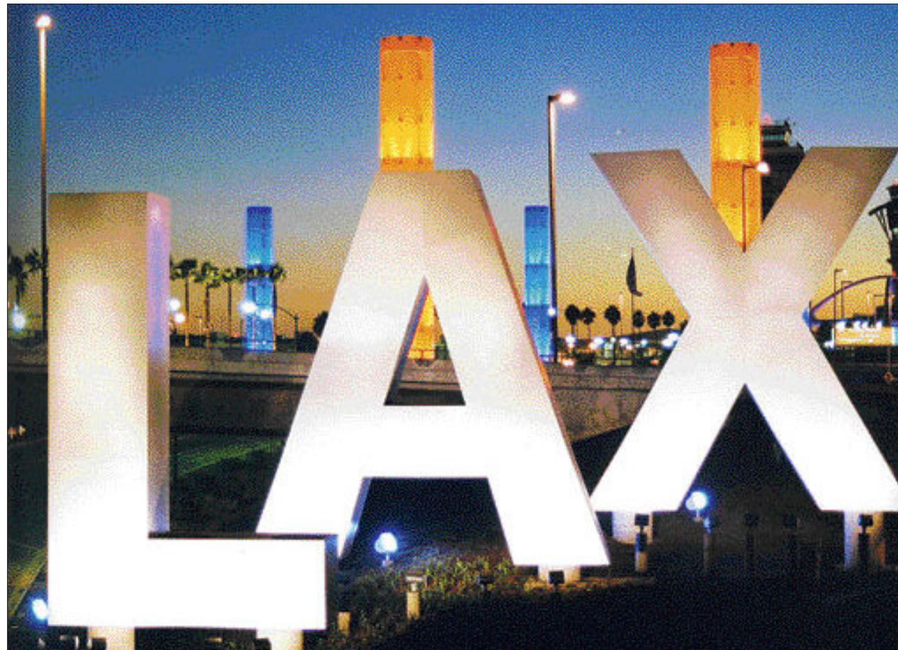
빛과 색의 조화를 적절히 활용해 도시의 야경을 바꾸고 미래지향적인 도시 이미지를 보여주고 있는 로스앤젤레스 국제공항(LAX) 일대 전경.

물론 도시의 밤 이미지는 이 모든 것들이 서로 공존하면서 만들어진다. 현재 광주시를 포함한 우리나라 대부분의 도시들은 간판 정비, 관련법 정비, 두 번째 단계의 도시 경관조명 및 관련 인센티브제 도입 등을 고려하기 시작하는 단계에 접어들었고, 곳곳에서 그러한 사례들을 찾아 볼 수 있게 되었다. 그러나 대부분이 비수하다. 문화도시이자 관광도시로, 빛과 강한 연관을 맺은 광주는 빛을 이용한 도시 이미지에서 다른 도시보다 월등해야 한다. 앞으로 만들어 나가야 할 문화도시·빛고를 광주는 건축물뿐만 아니라 공공미술로서 빛을 이용한 창의적이고 예술적인 다양한 시도들이 도시 곳곳에서 실행되어야 한다. 현재 광주에는 비엔날레와 디자인 비엔날레가 있다. 지금까지