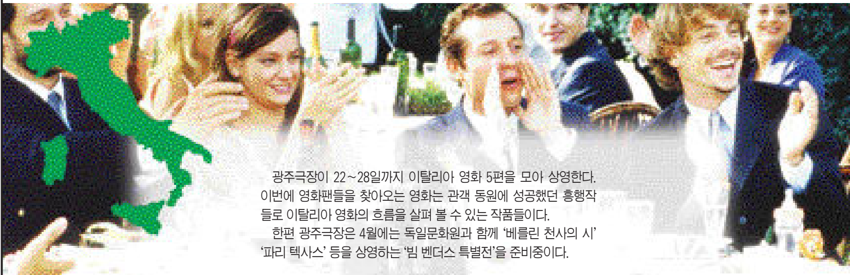
광주극장이 22~28일까지 이탈리아 영화 5편을 모아 상영한다. 이번에 영화팬들을 찾아오는 영화는 관객 동원에 성공했던 흥행작들로 이탈리아 영화의 흐름을 살펴 볼 수 있는 작품들이다. 한편 광주극장은 4월에는 독일문화원과 함께 '베를린 천사의 시' '파리 텍사스' 등을 상영하는 '빔 벤더스 특별전'을 준비중이다.