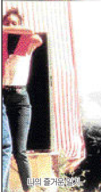
나의 즐거운 일기