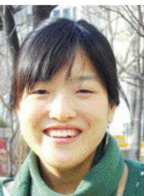
종로구의 한 보육시설을 찾아가 아이들을 돌봐주는 일을 하고 있다.