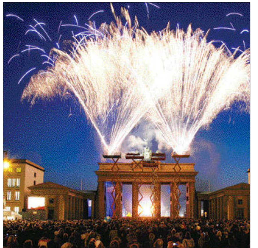
EU50주년 축하행사가 열린 베를린 브란덴부르크 문 광장에 수만명의 관광객이 운집한 가운데 25일 밤 화려한 불꽃놀이 행사가 벌어지고 있다.