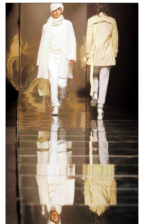
지난 28일 '2007 춘계 서울컬렉션' 현장에서 모델들이 제임모직 엠비오의 가을·겨울 패션을 선보이고 있다.