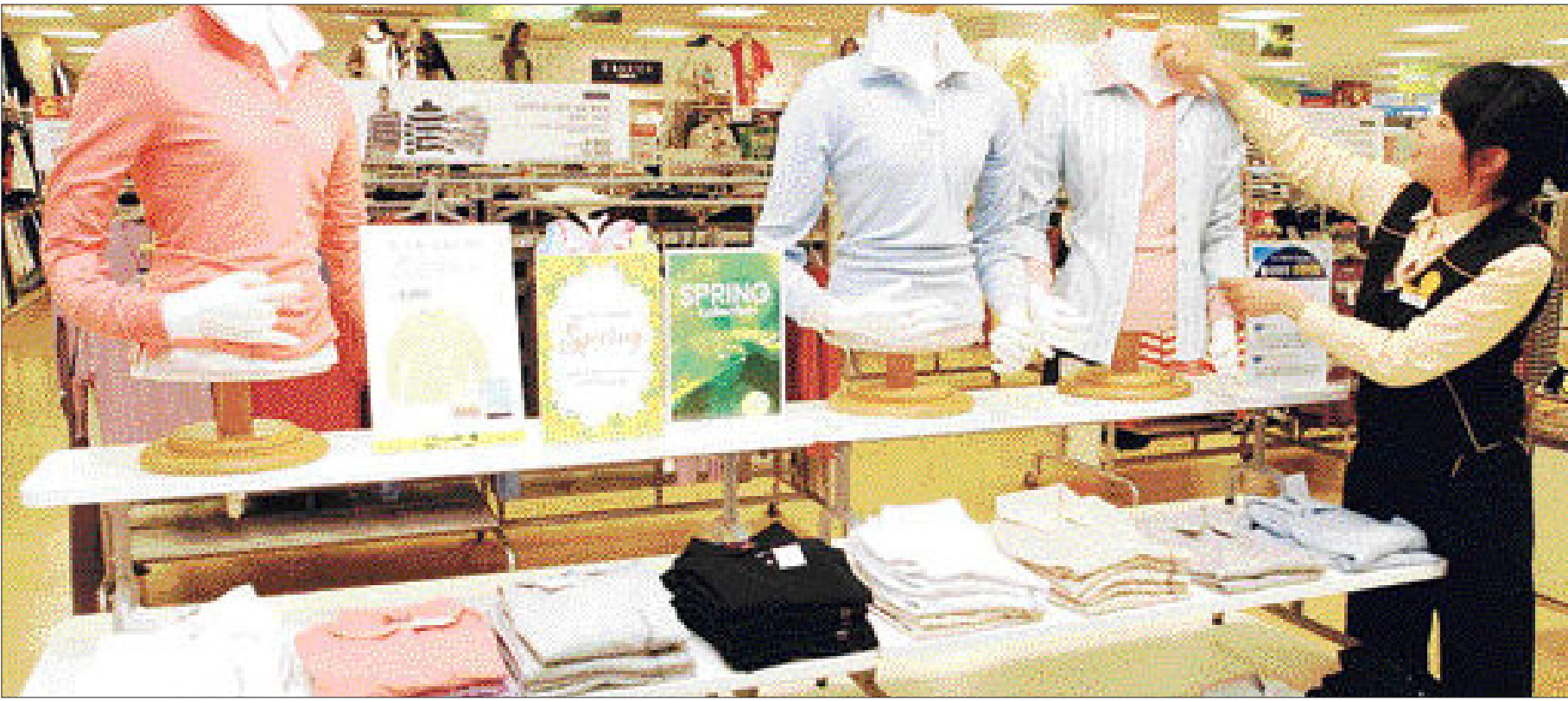
다양한 디자인과 합리적인 가격대를 내세운 대형마트의 자체 의류 브랜드가 인기를 모으고 있다.