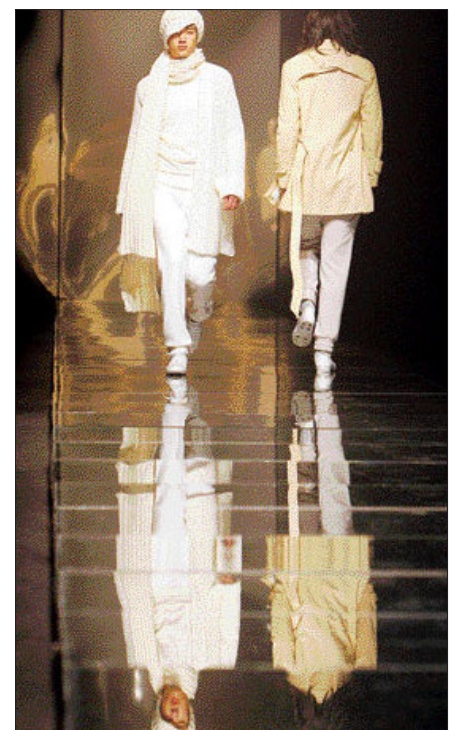
지난 28일 '2007 춘계 서울컬렉션' 현장에서 모델들이 제임모직 엠비오의 가을·겨울 패션을 선보이고 있다.