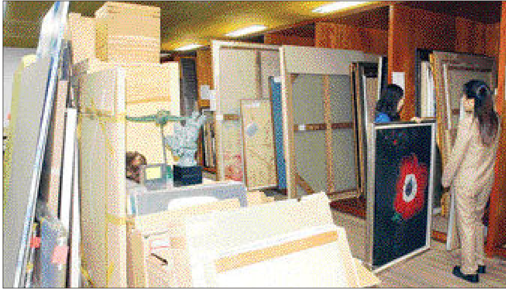
전국 지자체 가운데 가장 먼저 개관한 광주시립미술관이 명작을 바탕으로 한 체계적인 미술 컬렉션을 구축하지 못해 볼거리 없는 미술관이라는 지적을 받고 있다.