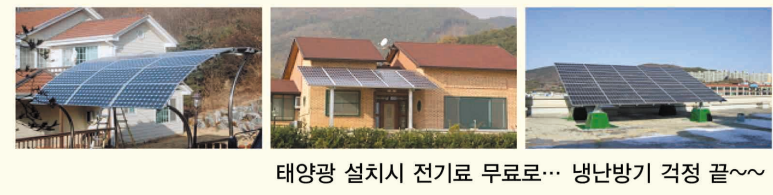
태양광 설치시 전기료 무료로... 병남방기 걱정 끝... 특히 어느 곳이든 신속하게 방문하여 친절하게 상담해 드립니다.