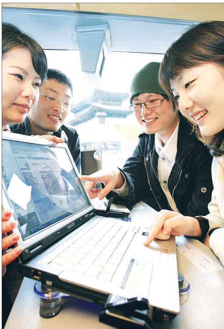
WIBRO(와이브로) 서비스가 서울 전역에 개시된 가운데 대학생들이 시애틀어비스에 설치된 노트북과 와이브로 단말기를 통해 실시간으로 서울시 관광 정보 등을 검색해 보고 있다.