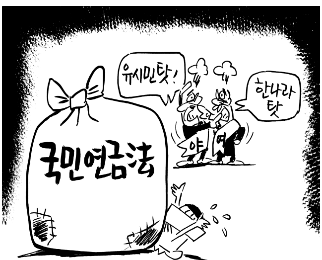
못된 버릇 또 나왔다