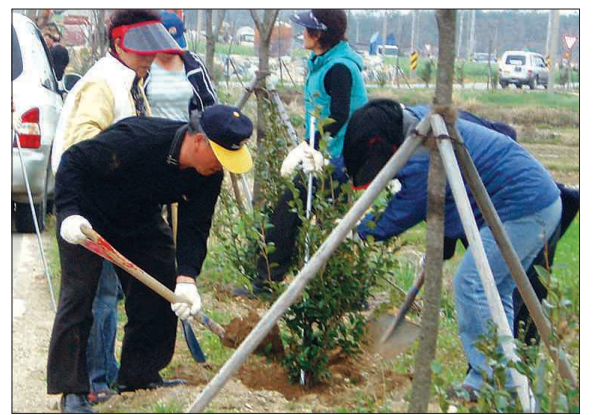
해 있어 꽃길이 조성되며 관광객들에게 아름다운 볼거리를 제공하게 될 것으로 보인다.

신안군 자은도에 산다화(애기동백) 꽃길이 조성되고 있다. 산다화 꽃길은 자은도 입구에서 맨소재까지 약 4km 구간에 조성되며 1천여 그루가 이달 초부터 6m 간격으로 식재되고 있다.