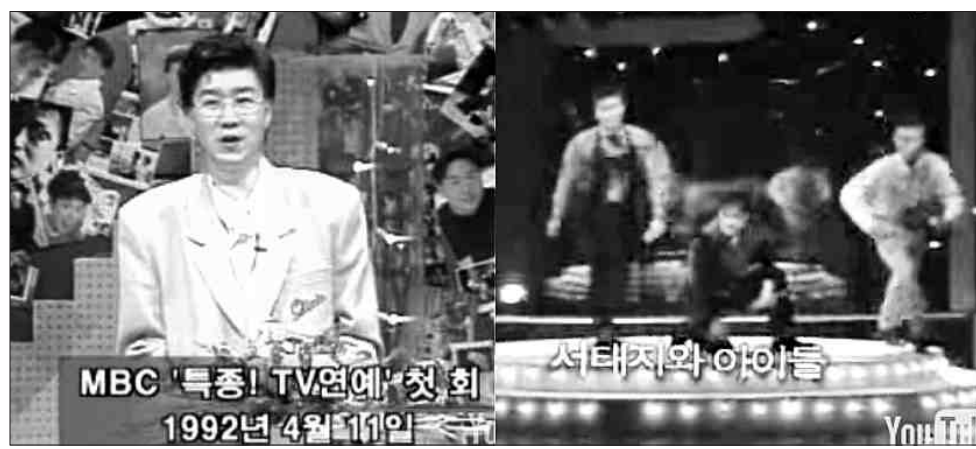
지난 1992년 4월 11일 한 방송사에서 첫 데뷔 무대를 가진 서태지와 아이들.

면 4집 '컴백홀'에서는 갠스태플을 선보이는 등 시대의 감수성을 읽어내면서 꾸준히 다른 모습을 보여준 것.