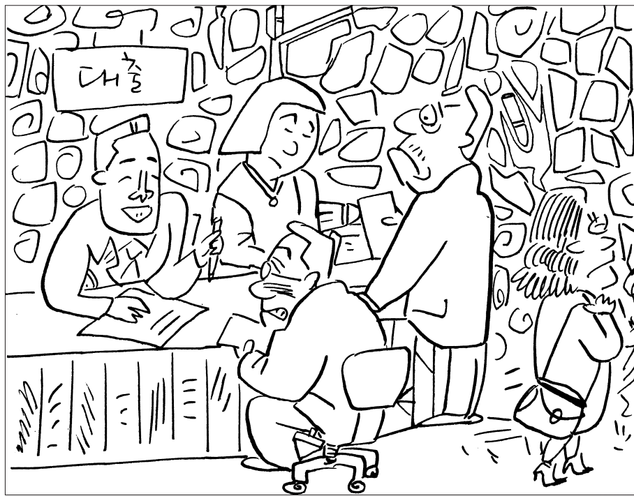
찾아보세요! 뽀이, 고추, 뚝딱배, 제비, 종이배, 서둘러, 열대어, 립스틱, 프라이팬