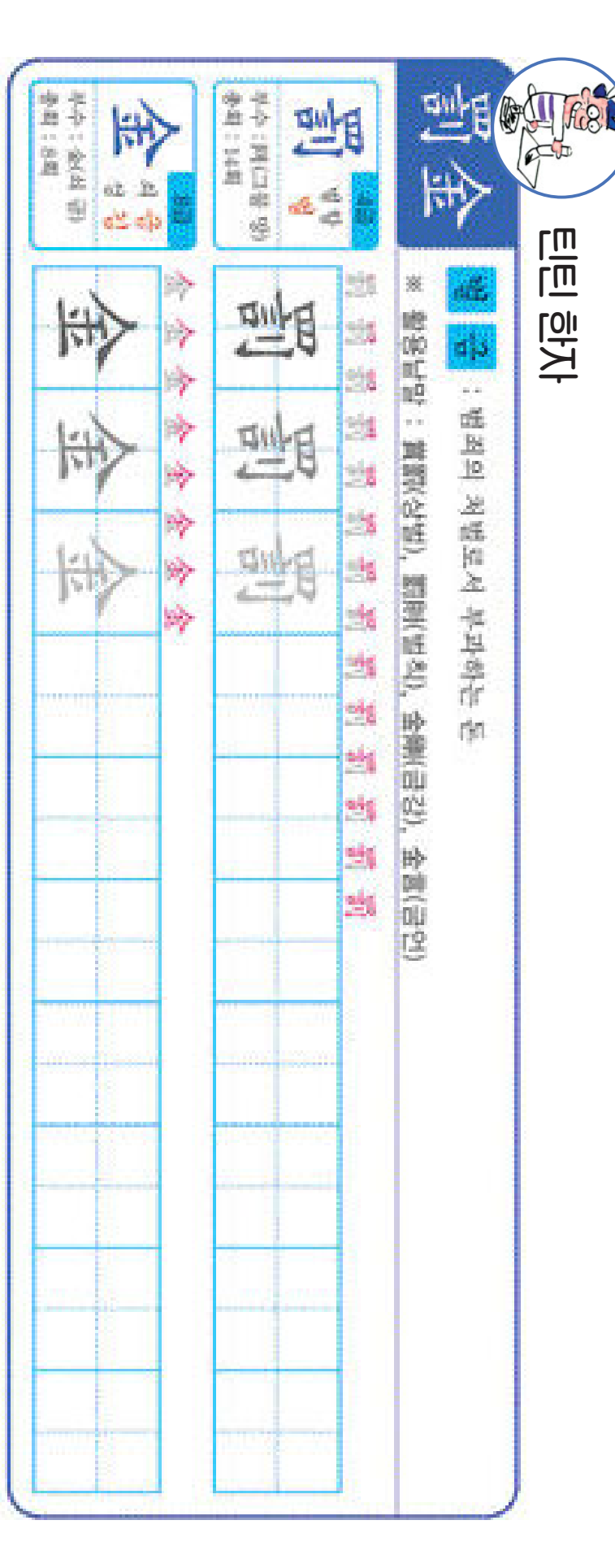
※ 벌과금 제도는 옛날에도 있었지만 과태료와 범칙금과 같은 關金이 너무 많다는 것이 여분(興論)의 다수를 차지한다.